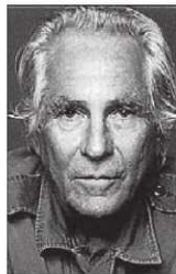
► Gordon Lish.

l'escritura i als seus famosos seminaris a Nova York. El tòpic diu que els seus llibres no tenen ànima, però els tòpics estan per ser revisats. A finals de l'any passat Perifèria va publicar Perú , una notable novel·la que Lish va reescriure quan ja a penes es tractava amb Carver. Val la pena llegir-la.